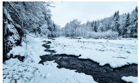
Mittels Sondierbohrungen wird die genaue Lage und die Beschaffenheit des anstehenden Felsmaterials an der Zug festgestelt.

Mittels Sondierbohrungen wird die genaue Lage und die Beschaffenheit des anstehenden Felsmaterials festgestellt. Die Bohrungen im Gebiet Zugboden wurden in der Woche vom 7. bis 11. Februar ausgeführt.