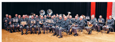
Berner Oberländer Militärspiel.