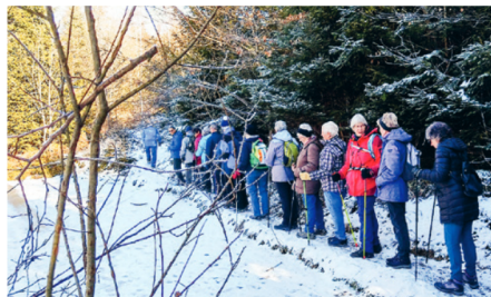
Ein kurzer Abstecher zur Wildsawchwadere. Die Senioren-Wandergruppe der Kirchgemeinden Steffisburg und Heimberg waren am Hartlisberg unterwegs.

Danach ging es bergab zum Pumpwerk Riederer, übers Riedererbödeli ins Eicheried. Auf der anderen Seite wieder bergauf zum Siechebode und zum Lindli, wo gerastet und noch einmal die Aussicht genossen wurde. Die Wanderung führte an bekannte Orte mit teils unbekanntem Flurnamen. Ein uralter Maulbeerbaum und die ersten Schneeglöckchen konnten bewundert werden. Ab dem Toggeligraben schrumpte die Wandergruppe, der kürzere Heimweg lockte. egs