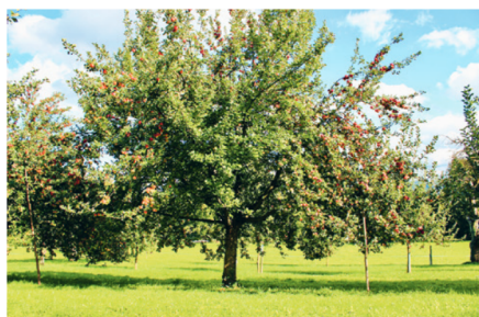
Der Beeriäpfelbaum ist die Obstsorte des Jahres 2022.

Mitte der Neunzigerjahre wurde der Verein Naturschutz Niederhelfenschwil-Zuzwil auf das langsame Verschwinden der ortseigenen Sorte aufmerksam. Der Verein suchte nach Standorten für junge Beeriäpfelbäume und war dabei so erfolgreich, dass 140 hochstämmige Jungbäume abgeben werden konnten. Einige Jahre danach finanzierte die Gemeinde Niederhelfenschwil die Virusfreimachung der Sorte, um eine reguläre Jungbaum-Produktion zu ermöglichen. Dank dieser Aktion sind nun seit 2017 in verschiedenen Schweizer Baumschulen zertifizierte Beeriäpfelbäume erhältlich. pd/sku