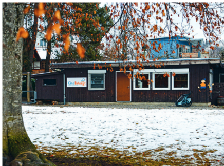
Die Kindertagesstätte Tigerente in Steffisburg.