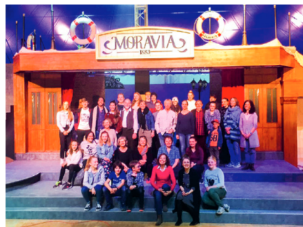
Da sind sie wieder – das engagierte Team der Oberländer Märlibühni, das sich seit 2019 für den «grossten Traum» einsetzt.

Weitere Informationen und Tickets: www.maerchenhaft.ch