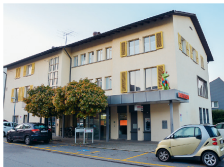
Die Raiffeisenbank Steffisburg will die Bankräumlichkeiten am Hauptsitz umbauen und dort auch Wohnungen realisieren.

Die für die Vorbereitungsarbeiten wichtige Planungssicherheit im Zusammenhang mit der Generalversammlung ist leider immer noch nicht gegeben. Somit werden die Genossenschaftlerinnen und Genossenschaftler auch in diesem Jahr wieder nur schriftlich über die traktandierten Geschäfte befinden können. Für weitere Hinweise verweist die Bank auf ihre Homepage www.raiffeisen.ch/steffisburg . Der Verwaltungsrat bedauert diese Ausgangslage sehr. pd